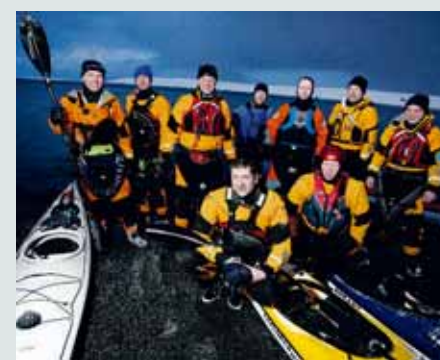
Róa Félagar í Kayakklúbbnum á leið í róður.